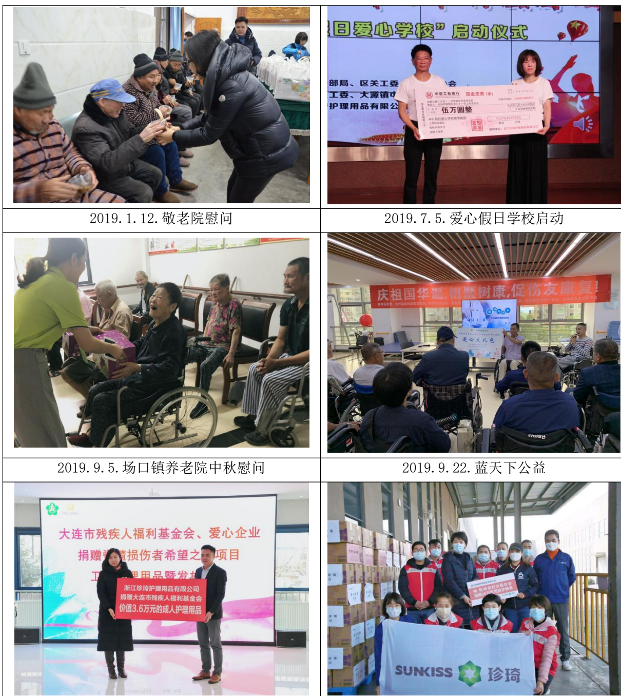
图表 17 珍琦护理部分公益活动一览表