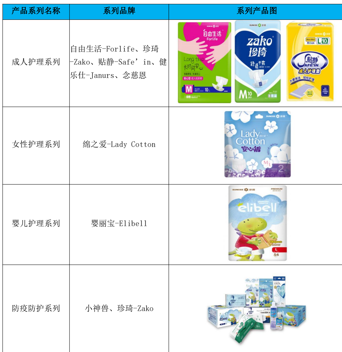
图表 2 公司产品种类及用途

公司致力于管理和创新工作，先后通过质量（ISO9001）、环境（ISO14001）、职业健康安全（ISO45001）体系认证。公司 2021 年导入卓越绩效管理模式。同时，公司建立了研发中心，通过引进业内优秀的人才，形成一支高素质的研发团队，并与东华大学合作进行新产品新技术的研究，整体技术水平业内领先。