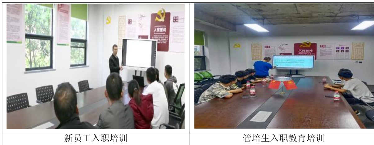
图表 7 员工培训

根据公司战略规划要求，为了更好的实现长短期战略目标和规划，根据绩效测量、绩效改进和技术变化的要求制定员工教育、培训计划，在分析各种需求与员工现有能力基础上，根据人力资源规划制定，“为每一个岗位的发展提供机会，为每一个员工的攀登创造条件”，我们本着“以德为先，以才为重，德才兼备，知人善用”的用人理念，将其作为建立完善培训管理体系的依据。