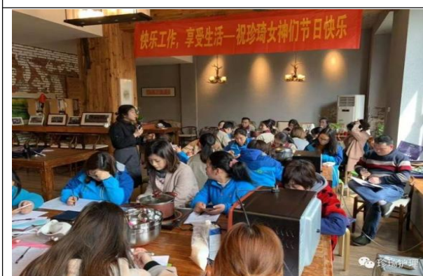
三八妇女节-西点课