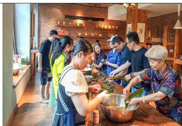
端午节包粽子活动