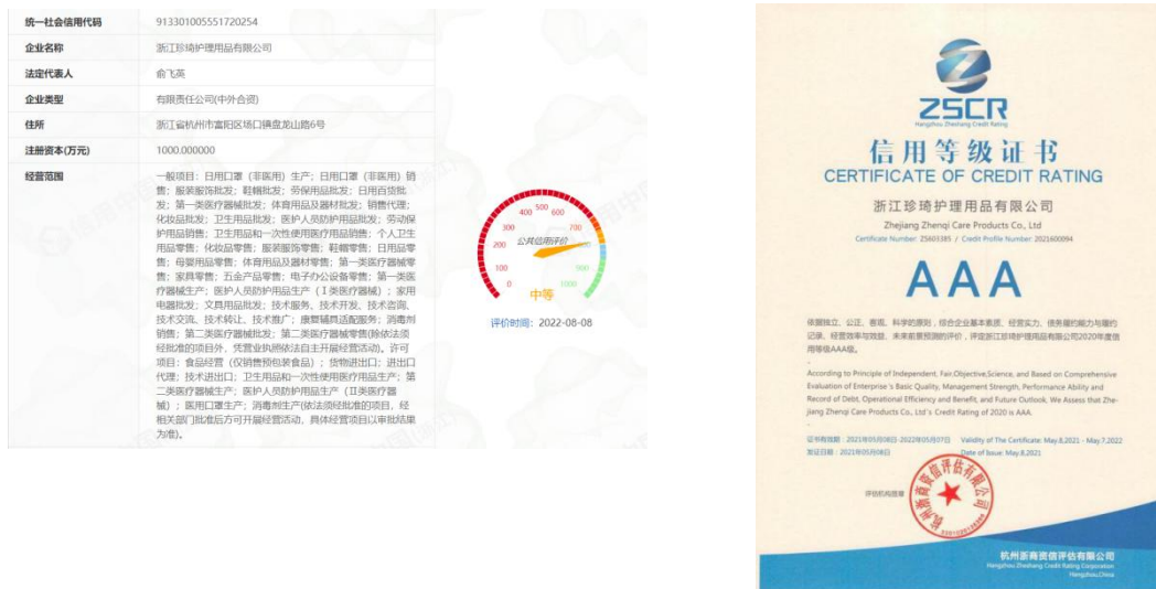
图表 14 道德行为相关结果