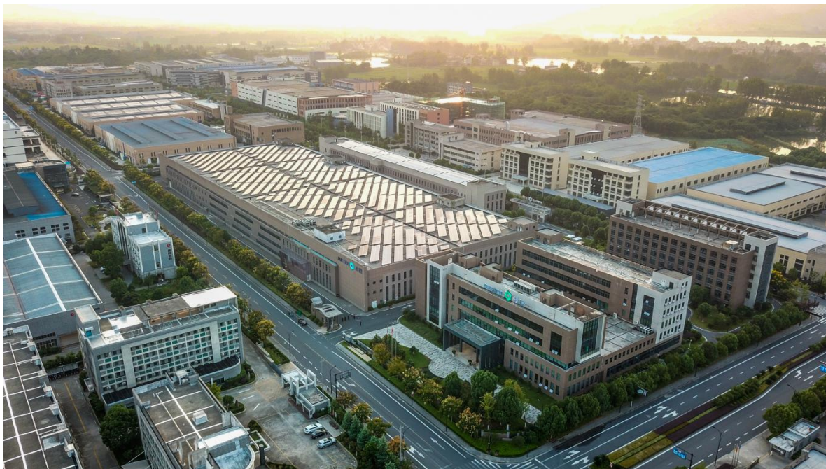
图表 1 公司总部厂区图

通过不断努力，公司取得良好的经营业绩。同时也得到了政府与社会的肯定，近几年获得荣誉，如下：